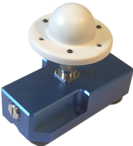
Abb. 3: Transceiver mit mobiler Fahrzeugantenne