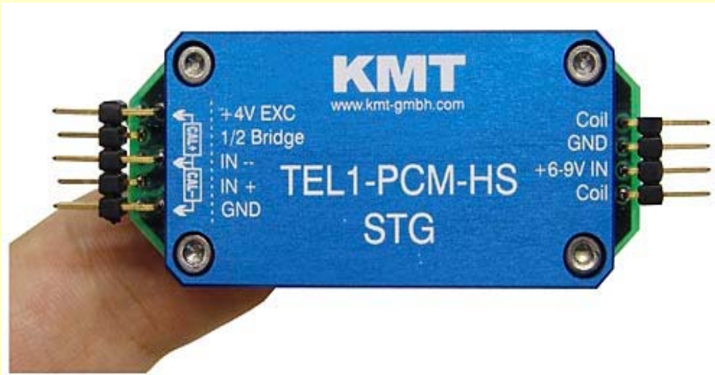
TEL1-PCM-HS-DEC - "Empfänger / Decoder"