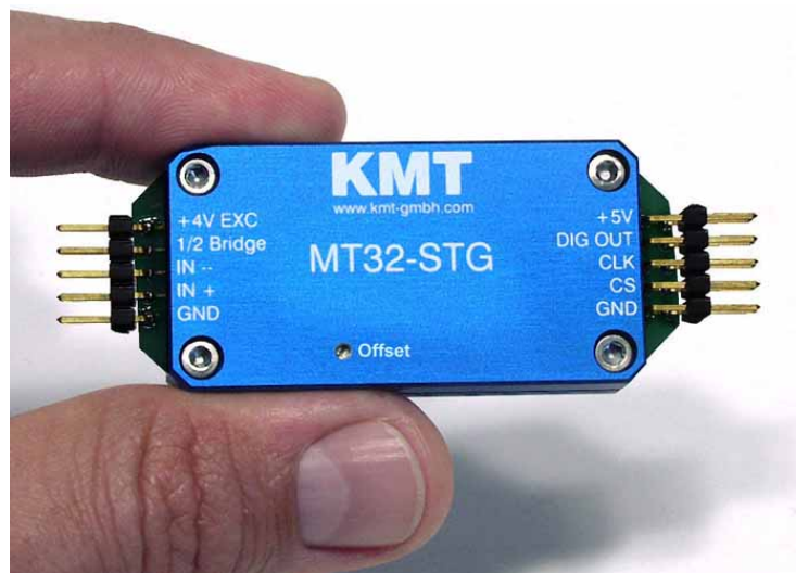
Abbildung 1: Die extrem kleinen MT32-Module beinhalten die komplette Signalaufbereitung, Filterung und Digitalisierung für einen DMS-, ICP- oder Thermo-Kanal

Die Palette der aktuell verfügbaren Signalaufbereitungsmodule umfasst DMS-Brückenverstärker, ICP-Verstärker für Beschleunigungssignale, Verstärker zum Anschluß von Thermoelementen vom Typ K sowie hochpegelige Spannungseingänge (Eingangsbereich: \pm 5 bzw. \pm 10V ). Das DMS Modul ist für Halb- und Vollbrücken mit Widerständen von mindestens 350Ohm geeignet. Die Offset-Kalibrierung erfolgt über ein Potentiometer am Modul. Optional ist auch ein digitaler Autozero-Abgleich für alle angeschlossenen DMS-Module per Mikroschalter im Multiplexer möglich. Der Abgleich kann dabei in einer Spanne von bis zu 80% des Meßbereichs erfolgen und geht bei Unterbrechung der Spannungsversorgung nicht verloren.