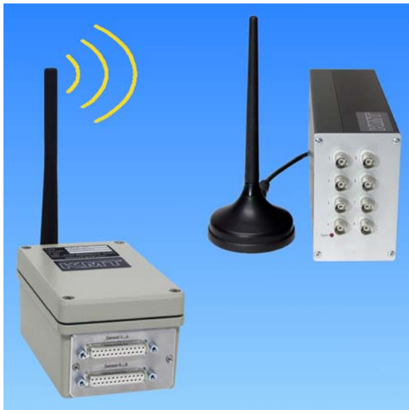
CT8 8-Kanal-Telemetrie mit MT32-Modulen

Auf Grund der Modularität läßt sich das System für nahezu jede beliebige Applikation adaptieren. Denkbare und schon realisierte Anwendungen sind u.a. im Bereich der Meßdatenerfassung an Propellern und Rotoren (z.B. Hubschrauber oder Windräder), an Flügeln, Felgen oder rotierenden Teilen jeder Art sowie auf Motorrädern und Fahrzeugen.