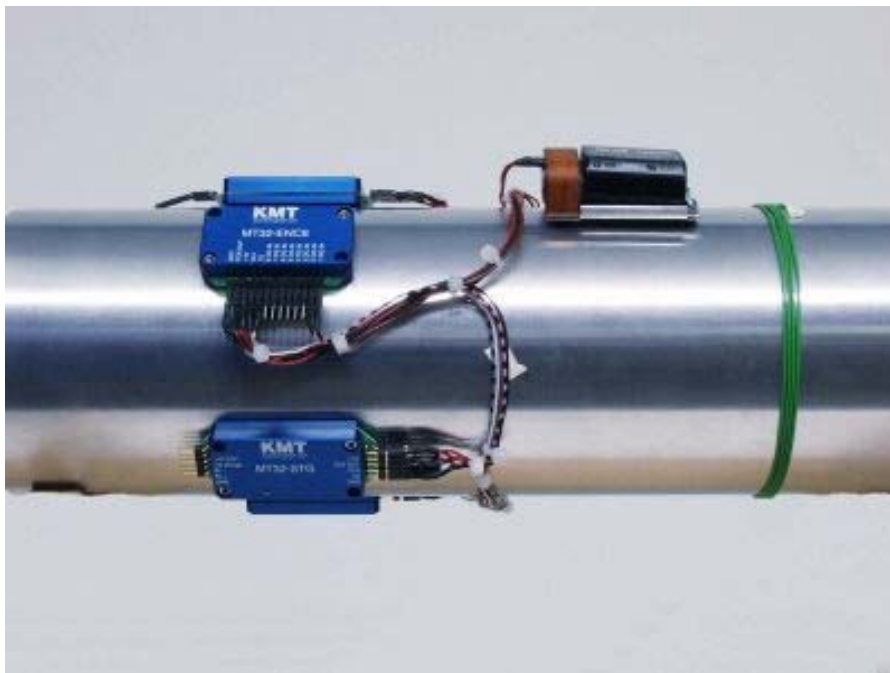
Abbildung 2: Applikationsbeispiel mit DMS-Modulen, Multiplexer- und Sendemodul, Akku-Pack und Ringantenne auf einer rotierenden Welle

Auf der Empfängerseite werden die decodierten Signale an einer kompakten Wiedergabeeinheit entweder über BNC-Buchsen analog (Ausgangsbereich: \pm 5\text{V} ) abgegriffen oder über ein Digital-Interface (für ISA- bzw. PCI-Bus oder PC-Card) direkt an einen PC weiter gegeben. Die Genauigkeit des Gesamtsystems ab Sensor ist mit \pm 0.5\% spezifiziert. Die Wiedergabeeinheit wird wahlweise über ein internes DC-Netzteil mit einem Spannungsbereich von 10 bis 30 Volt oder über externes AC-Netzteil mit einem Spannungsbereich von 110 bis 230 Volt versorgt.